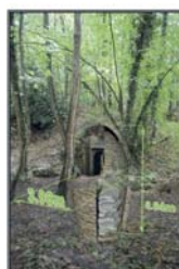
La glacière Simulation en 3D de la partie inférieure.