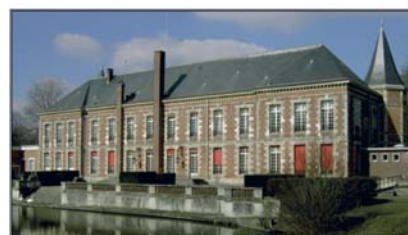
Le bâtiment actuel est la propriété de l'Association des Paralysés de France depuis 1949. L'Institut d'Éducation Motrice accueille 70 jeunes